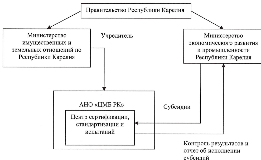
Рис. 1. Система управления ЦССИ