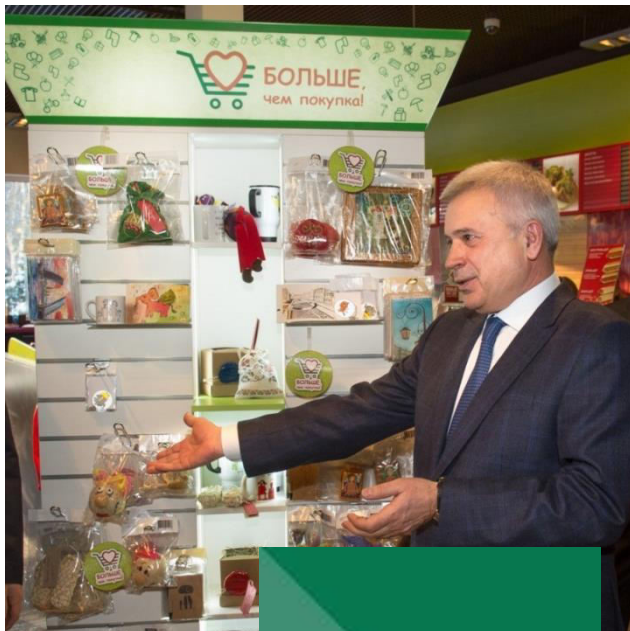
Вагит Алекперов, Учредитель Фонда «Наше Будущее»

Фонд «Наше будущее» — первая организация, системно развивающая социальное предпринимательство в России.